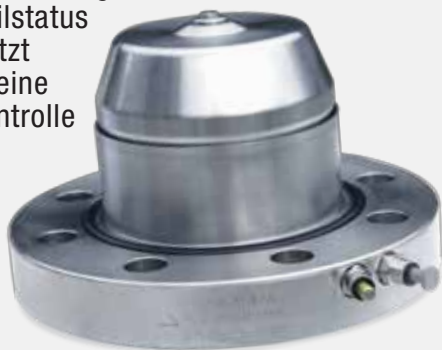
Edelstahl Bodenventil Typ GPBV