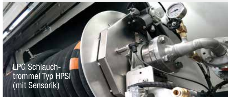
LPG Schlauch- trommel Typ HPSI (mit Sensorik)